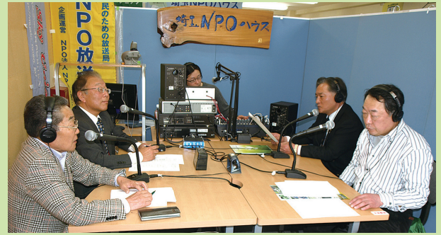
日進親和会、七夕についてお話ししました。